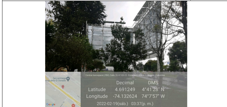
Foto 2. Panorámica de la valla sentido Oeste-Este y de la estructura tubular en buenas condiciones y estable. Se evidencia que no concuerda la orientación del elemento con la autorizada en la Res. 03646 de 2019.