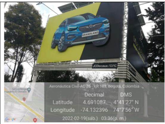
Foto 3 y 4. Vista panorámica de la valla instalada en el separador y de los paneles publicitarios, en donde se evidencia que el elemento tiene una cara con orientación sentido Sur-Norte (no autorizada), paralela a la calzada de la Calle 26 (foto 4).